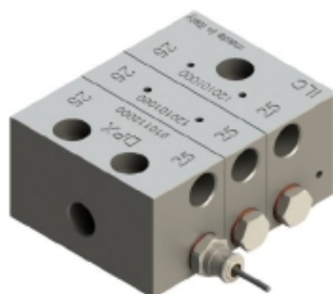
Pictured = 6-fold DPX with visual indicator